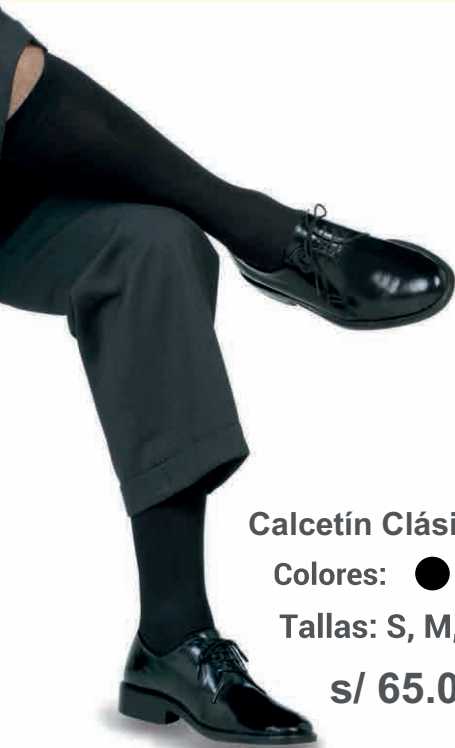
Calcetín Clásico caballero