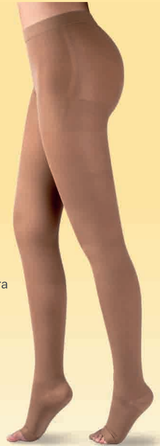
Panty Opaca DL