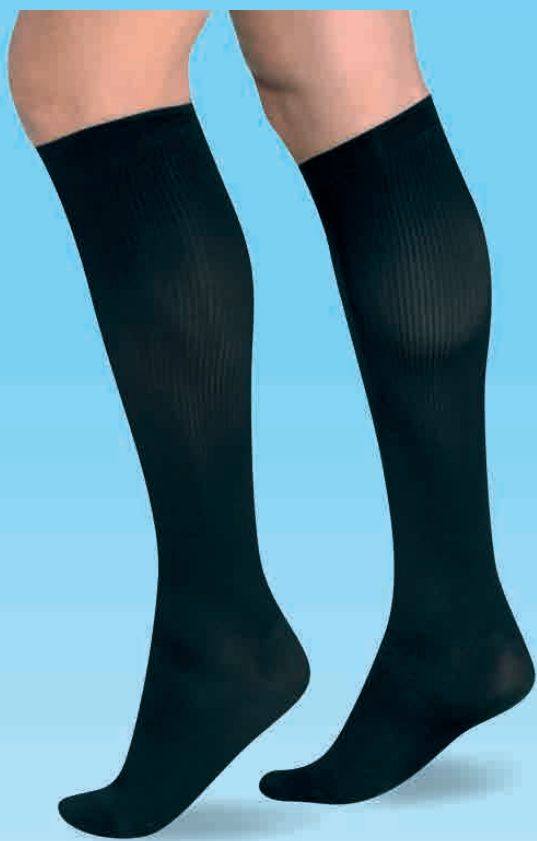
Calcetín Acanalado Caballero

Recomendada para uso preventivo en pacientes con factor hereditario y/o condiciones de trabajo de pie o sentado mucho tiempo