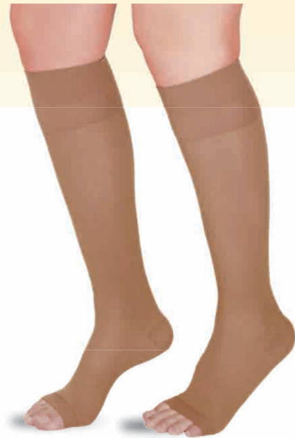
Rodilla dedos libres