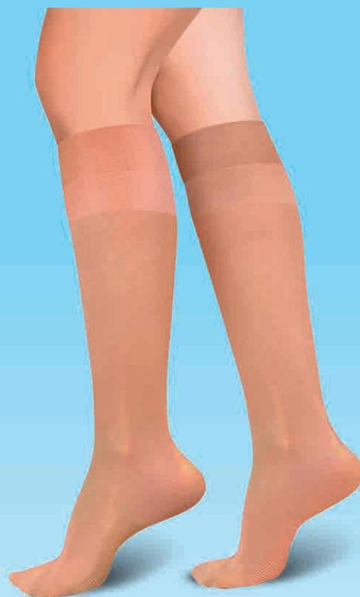
Rodilla Transparente Dama